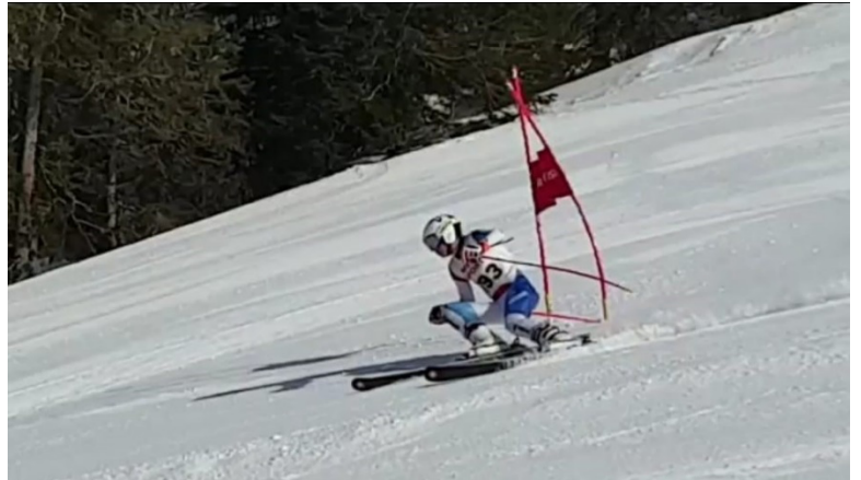
Jahr 2022 (Meli Sport)